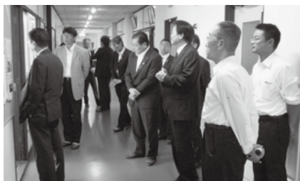
市立米子養護学校の調査

9月定例会では、本委員会所管の27年度一般会計補正予算の本委員会所管分など5議案を審議し、原案通り可決した。「退職手当不支給処分に対する審査請求の裁決」に係る諮問については、飲酒運転が不起訴であった点、退職手当の報償的性格や賃金の後払い的性格等を併せ持つ点、さらに、この裁決が審査請求人の人生・生活に極めて重大な影響を及ぼす点を考慮しつつ、慎重に審議した結果、諮問に対する議会に対する意見は、棄却とする。