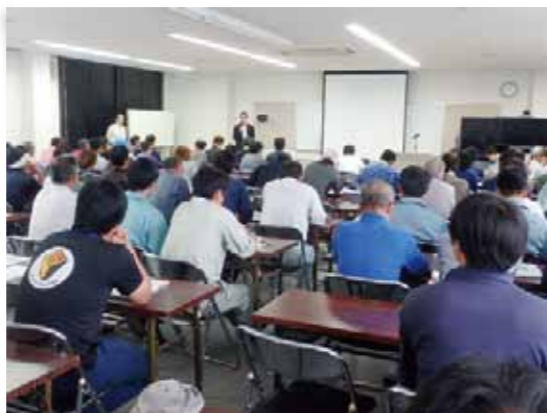
労働災害発生防止研修会 9/24(木)