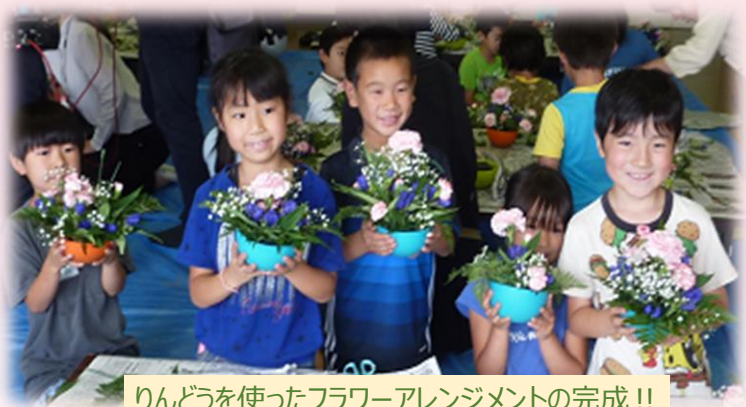
りんどうを使ったフラワーアレンジメントの完成!!