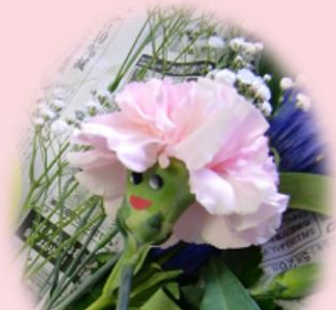
カーネーションで顔を作ったよ。