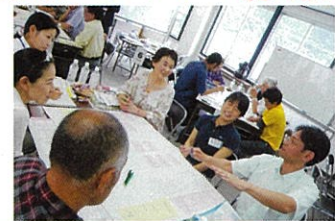
◀ミーティングの様子