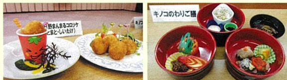
【日野郡ランチ開発で試作したメニュー】