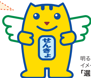
明るい選挙の イメージキャラクター 「選挙のめいすいくん」

政治・選挙について 一緒に考えてみよう。 きっと 投票に行くという考えを 持つことができるはず。