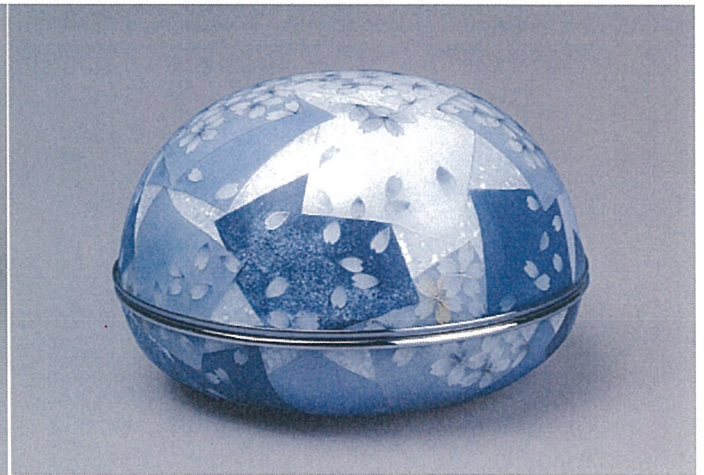
有線七宝合子「風香る」