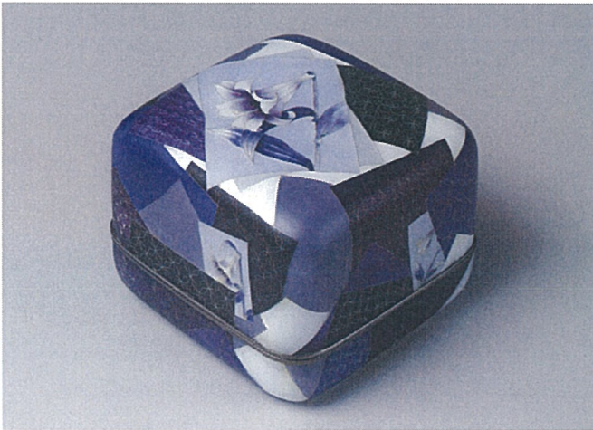
有線七宝蓋物「花野」

その作品は近年、第25回伝統工芸諸工芸部会展（2015年）で文部科学大臣賞、第54回（2011年）および第59回日本伝統工芸中国支部展（2016年）で鳥取県知事賞を受賞するなど高く評価されており、鳥取県を代表する七宝作家である。