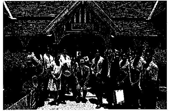
マニング高校での高校生による歓迎

ジャマイカで2番目に歴史のあるマニング高校（1738年創立）を訪問し、地元高校生と交流を行った。