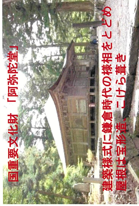
国重要文化財「阿弥陀堂」