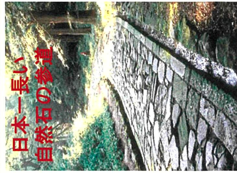
日本一長い 自然石の参道