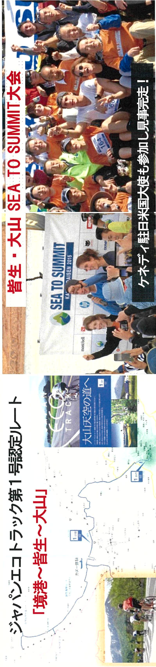
皆生・大山 SEA TO SUMMIT 大会