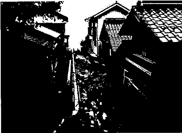
鳥取市鹿野町岡井地区被災状況(9/12 被災)