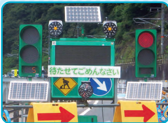
▲ユニークな言葉でドライバーに注意を呼びかける看板▼

日野郡内の工事現場で見かけた、アニメのキャラクターやマスクोटなどを描いたパリケードや、ドライバーへの注意喚起のためのユニークな文章の看板を紹介します。