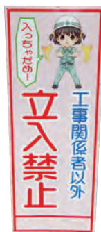
▲ソフトなイメージのイラストを用いた看板