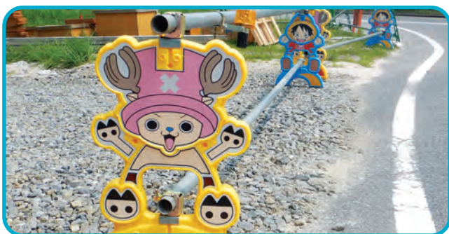
▲子どもたちに人気のアニメのキャラクターをデザインしたパリケード