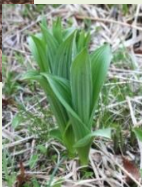
芽出し期 のコバイ ケイソウ