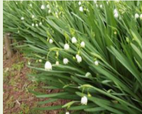
スノーフレーク (スズランスイセン)