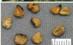
チョウセン アサガオの種