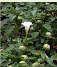
チョウセン アサガオの葉と花