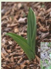
芽出し期 のバイケイ ソウ