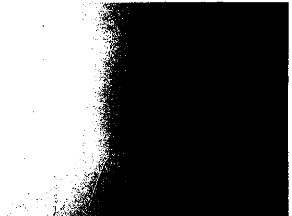
【病棟壁のクラック】