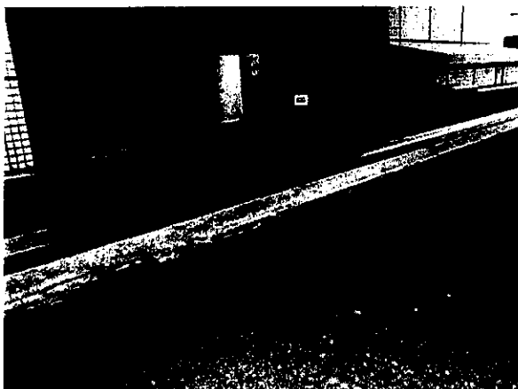
【救急入口付近の段差】