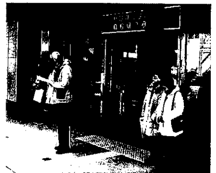
【模擬110番体験（平成28年）】