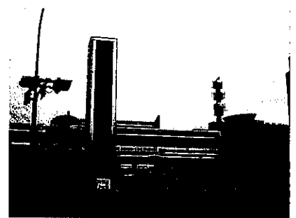
【県庁前電光掲示板（平成28年）】

警察本部の総合窓口 nationwide 統一番号（#9110）の警察相談専用電話を設置し、電話をかければ発信地を管轄する警察本部等の総合窓口へ接続されるようにしている。総合窓口には、警察職員のほか、経験豊富な元警察職員等の警察安全相談員を配置している。