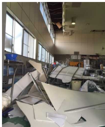
地震で被害を受けた倉吉市給食センター

12/8からは、近隣の鳥取短期大学の給食管理実習施設を無償で借り受け汁物の調理を開始。