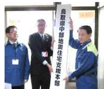
「鳥取県中部地震住宅支援本部」設置(11月1日)