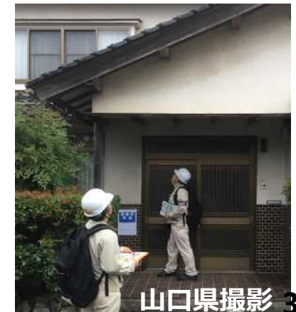
建物の被災状況を 確認する応援職員