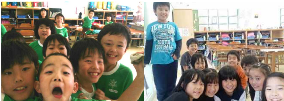
元気な子ども達の声は復興への大きな力に