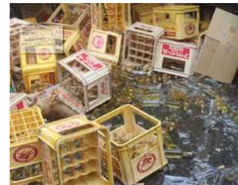
ワイン醸造所の被災例(商品破損)