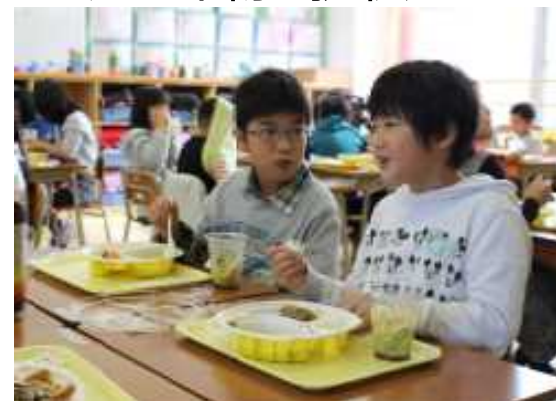
温かい食事子ども達も笑顔に