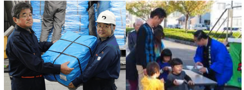
熊本県から贈られた ブルーシート