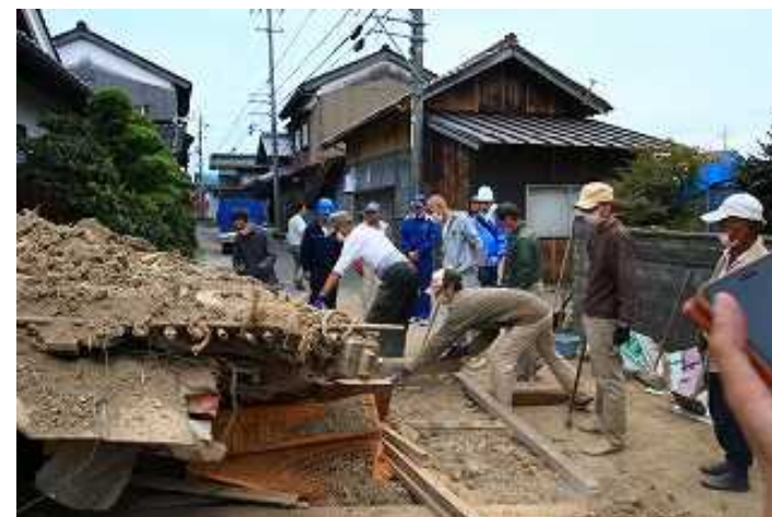
【崩壊した家屋(北栄町)】