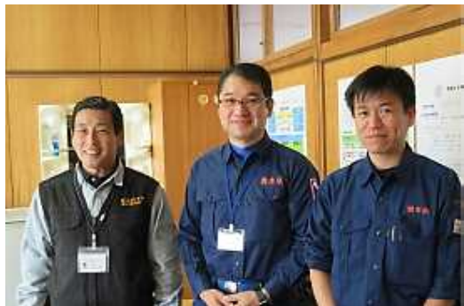
兵庫県や熊本県の専門チームも学校運営を支援

スクールカウンセラーを地震の被害が大きかった県中部地区の学校に派遣し、子ども達の心に寄り添ったサポートを展開。