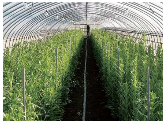
北栄町のシンテッポウユリ (ハウスさいばい)