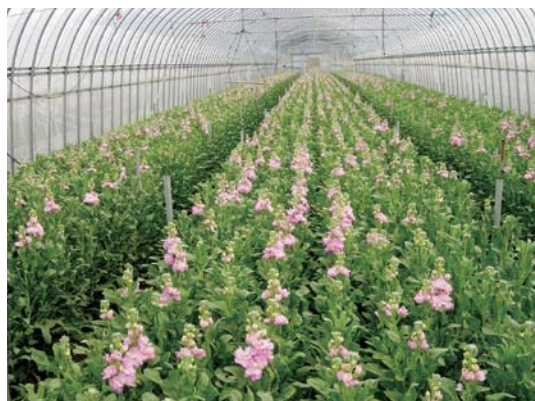
北栄町のストック

北栄町ではハウスを使ったすいかづくりがさかんです。6月にすいかをしゅうかくした後，そのハウスでストックやゆり（シンテッポウユリ），アスターなどをさいばいしています。鳥取県のストックさいばいは全国的にも有名で，県を代表する切り花です。