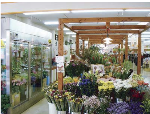
町にある花屋さん