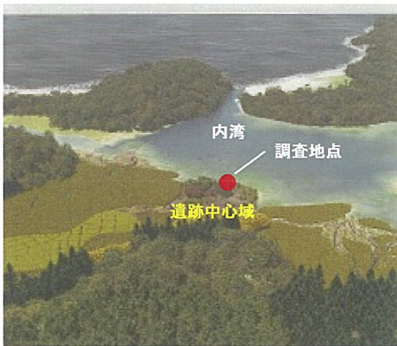
弥生時代（1800年前）の青谷平野復原図

港の確認には発掘調査が必要。平成29年度もボーリング調査を継続して行うとともに、今回採取した土壌の科学的分析や既存ボーリング資料の再検討等を行い、それらの成果を踏まえて平成30年度以降に港の確認を目指す発掘調査を実施する。