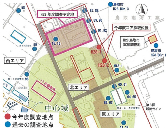
ボーリング調査地点位置図