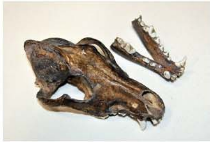
ニホンオオカミ頭骨 (愛媛県総合科学博物館蔵)

〒680-0011 鳥取県鳥取市東町二丁目124 TEL.0857-26-8042 FAX.0857-26-8041 ホームページ https://www.pref.tottori.lg.jp/museum/ E-mail: hakubutsukan@pref.tottori.lg.jp