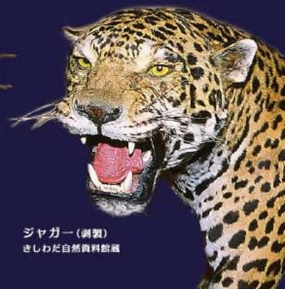
ジャガー(剥製) さしわだ自然資料館蔵