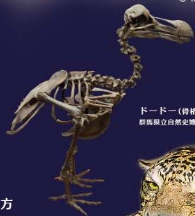
トードー(骨格複製) 群馬県立自然史博物館蔵

大学生以下の方、70歳以上の方 学校教育活動での引率者、障がいのある方 難病患者の方、要介護者等およびその介護者