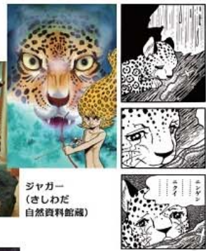
ジャガー (さしわだ自然資料館蔵)