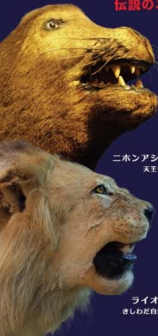
ニホンアシカ(剥製) 天王寺動物園蔵