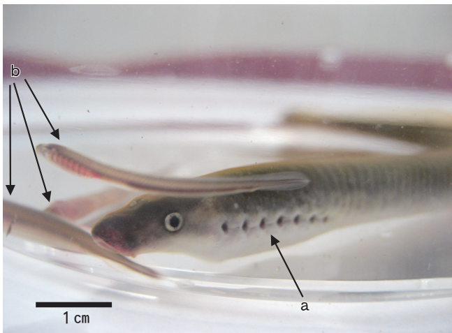
図4. 麻生樋門で、2007年11月に採取されたスナヤツメの成体(a)と幼生(b)。

これらの変化の中で特に重要と思われる事実は、2006年11月と12月および2007年10月と11月にスナヤツメの成体が採取され、2007年4月と8月、10月、11月に、スナヤツメの幼生が採取されたことである。2007年10月と11月に採取された多数のスナヤツメの幼生の多く(合計27個体中24個体)は、3~5cmの非常に小型の幼生であったことも重要な事実だと思われる(図4)。