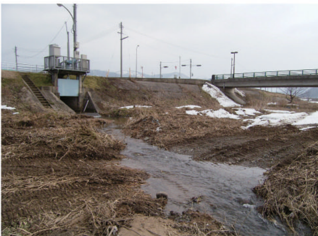
図2. 2006年1月の工事直前の麻生樋門の状況（河川敷のヨシは刈り取られている）。

筆者らがはじめて麻生樋門を訪れた2002年5月の時点では，排水のルートは，直線の最短ルートになっており，樋門を出た水は，樋門の前で長径3m，短径2.5m，最深部深さ0.7m程度の溜まりを形成し，そこから袋川本流に向かってほぼ一直線に流れていた（図2）。溜まりや排水ルートを取り囲む河川敷はヨシが優先し，まばらにオオブタクサも繁茂していた。溜まりの底は，主に砂が，有機物（枯葉の断片等）とともに堆積しており，岸近くの浅瀬に近づくにつれて，砂はより小さくなり，中に混ざる有機物の量は増えていた。溜まりの中心部には1-3cm程度の礫も多数見られ，また，溜まりから本流に向かう排水のルートの底は，同様な礫で被われていた。