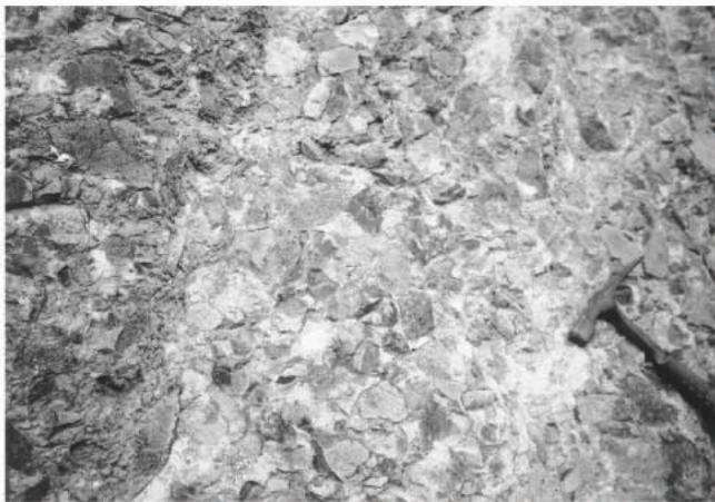
図8 ハイアロクラスタイト起源の再堆積した 複数の岩屑流 風化の進行に伴って色調が強調。