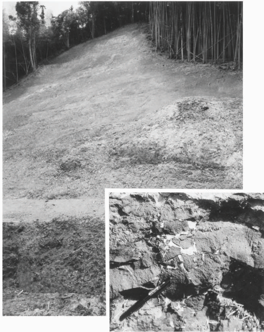
図6 露頭No.10の堆積構造