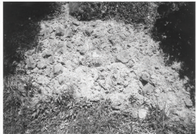
図9 伏野 (Fs) におけるハイアロクラスタイトB型 (Angular fragment breccia)