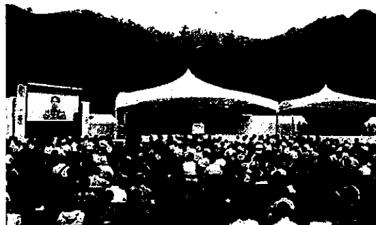
第1回大会(長野県)の記念式典の様子→

山に親しむ機会を創出し、山の恩恵に感謝する機会とすることを目的に、平成28年8月11日に初めての祝日を迎えたことを記念し、その制定趣旨を周知するため開催されている。