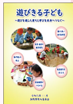
「鳥取県幼児教育振興プログラム(第2次改訂版)」(令和元年11月)