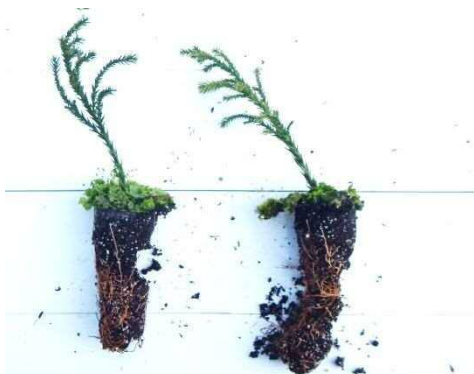
図 3 片根による培土の崩れ