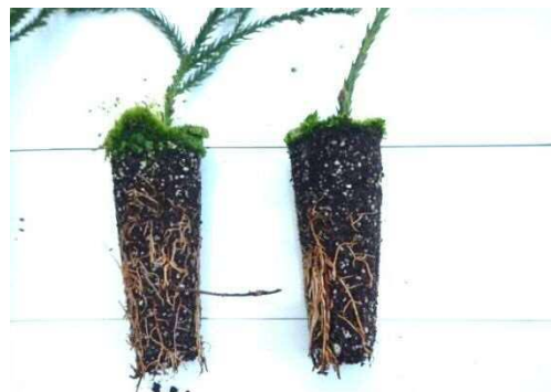
図 4 根系発達的位置 コンテナ上部には根系が発達していない。