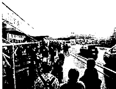
砂丘前商店街のにぎわい