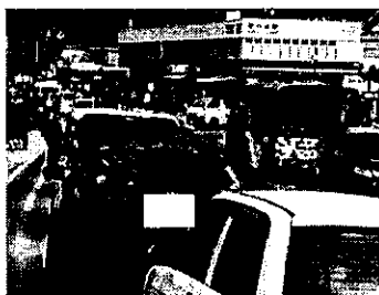
砂丘駐車場待機列