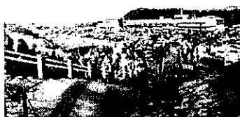
砂丘入口階段の混雑