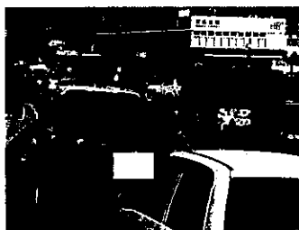
砂丘駐車場待機列