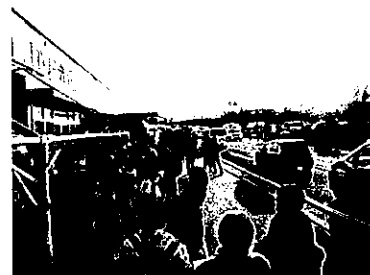
砂丘前商店街のにぎわい