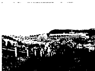
砂丘入口階段の混雑