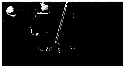
土質が想定と異なる砂であり大型土のう締切を鋼矢板施工に変更