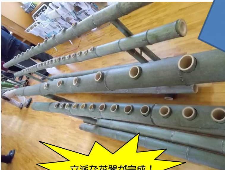
立派な花器が完成！