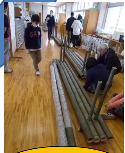
最後の取り付けを児童に 手伝ってもらいます