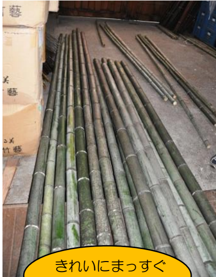
きれいにまっすぐ 伸びた竹を使用