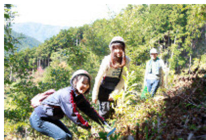
「ごうぎん希望の森・智頭」