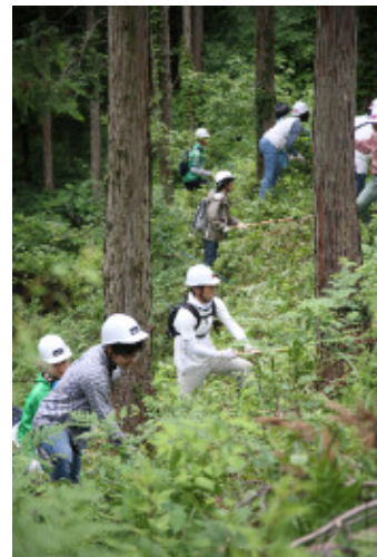
「ごうぎん希望の森・奥大山」