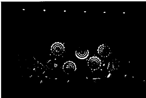
（平昌文化五輪・海外姉妹都市公演での桜道里の公演）