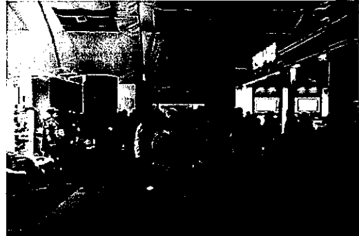
（観光広報ブースで傘踊り披露）