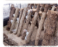
ハウス内で1つつばねがけされ大切に育てられる

原木生しいたけ「鳥取茸王」、「とっとり115」は、昭和40年代に日野郡の山林で発見された野生の菌をもとに、(一財)日本きのこセンター(鳥取市)が開発した「菌圃115号」という菌を使って育てられる鳥取生まれのしいたけです。原木に植菌し、1年間しっかり管理して菌を蔓延させた後、12月頃から3月頃まで、生産者が手開きかけて肉厚な「ジャンボ椎茸」に育てていきます。