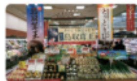
スーパー「マルイ」での特設販売コーナー

鍋料理によし! 焼き物によし! 冬季だけに味わうことができる「鳥取茸王」と「とっとり115」是非ご賞味ください。