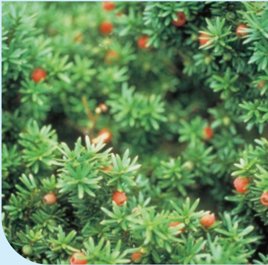
県木（ダイセンキョラボク）