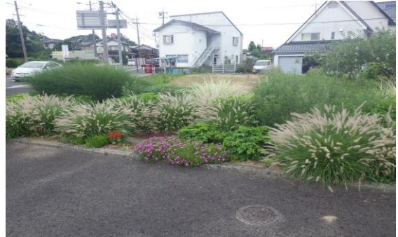
住民による植栽・管理（平成28年8月）