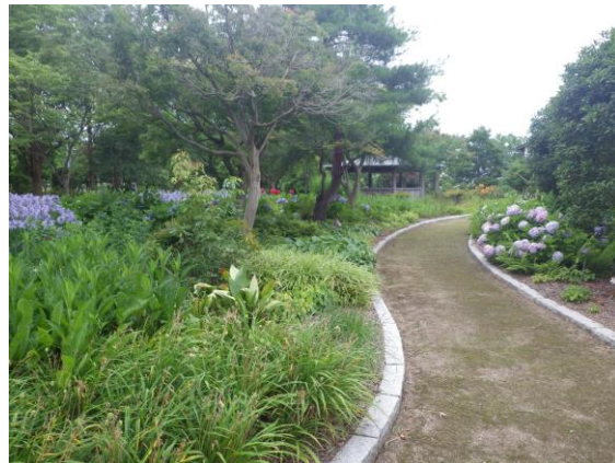
散策路沿いの低木植栽を草本植栽に転換（平成 28 年 6 月下旬）