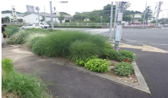
交差点付近緑地帯（平成28年8月）

【概要】市民活動によるナチュラルガーデン整備事例。多くの人々の目にとまるまちなかのスポットとして道路沿道等の公共空間の修景緑化。鳥取市では平成24年度より、全国都市緑化フェアの開催に併せて、市内の都市公園や公共空地に「まちなかスポット」としてミニナチュラルガーデンを設置しており、緑化フェア終了後も引き続き設置。草花などは鳥取市からの補助、植え付けや維持管理などを（公財）鳥取市公園・スポーツ施設協会が指導。