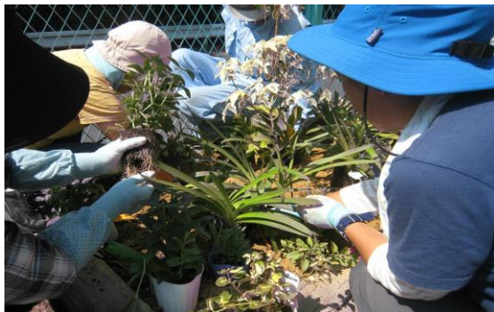
深澤公園（平成25年8月）