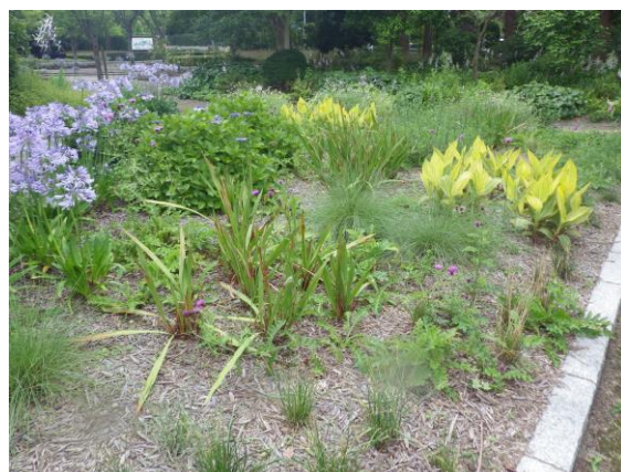
四阿周辺は四季の草花を配植して景観に配慮（平成 28 年 6 月下旬）