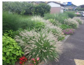
ナチュラルガーデン整備事例