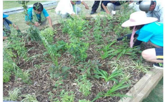
浜村砂丘公園（平成25年7月）