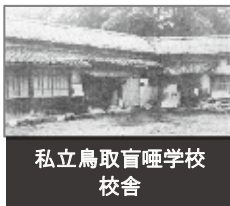
私立鳥取盲啞学校 校舎