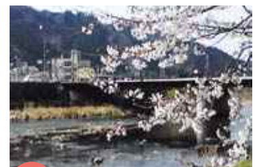
入賞 「春の日野川」 野坂政昭