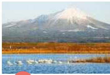
入賞 「白い共演」 輝楽

川沿いを散歩中に思わず、シャッターをきりたくなる瞬間が訪れました。様々な命が生まれる川は素晴らしい景色も生んでくれるみたいです♪ (撮影場所)米子市