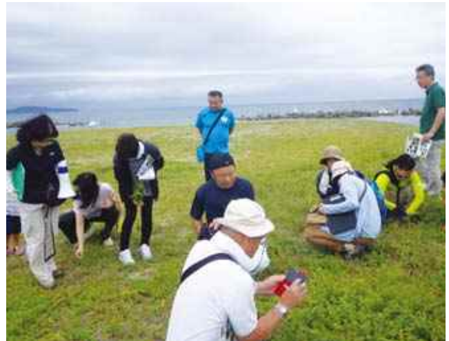
▲日野川河口・海岸植物等学習会

8月最後の日曜日、早朝の日吉津海岸に約500人のボランティアが集まり、浜辺を一斉清掃しました。日野川の源流と流域を守る会からも30名以上が参加し、気持ちの良い汗を流しました。