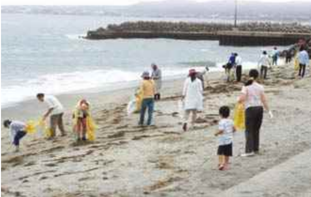
▲日吉津海岸クリーン作戦の様子