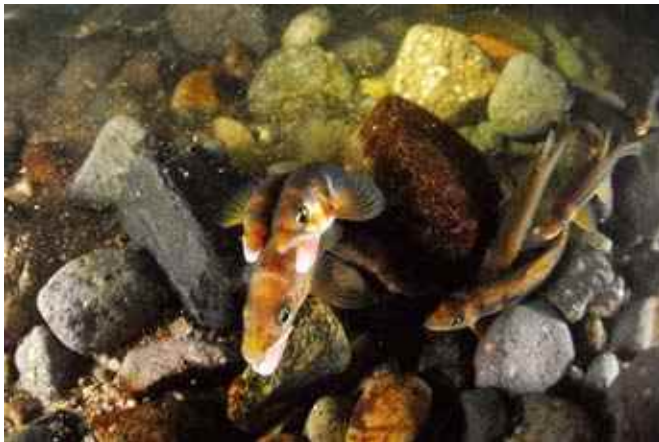
「アユ、産卵の時。」中谷英明