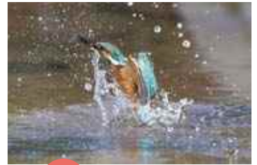
入賞 「日野川の」 穴