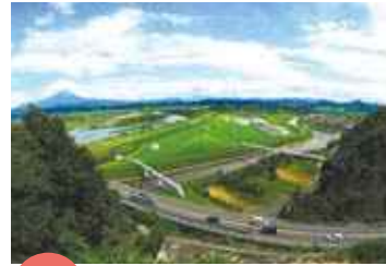
入賞 「街を潤す」 しげまん