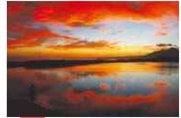
入賞 「水鏡」 りん☆たろう