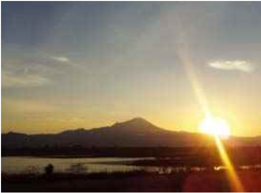
「川沿いから望む光」 ちゃぼ