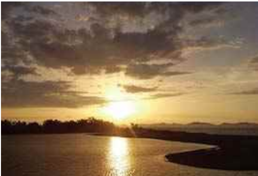
「夕日の向こうには明るい明日がある」 chihiro