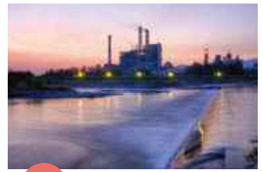
入賞 「朝の王子」 てんぎゅ