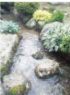
入賞 「この水も日野川の源流」 ははまる