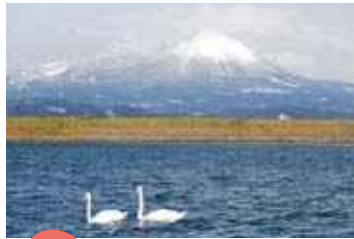
入賞 「水入らず」 大山散歩

日吉津へ向かう途中に見た空があまりに眩しく、きらきらと光った川がとても美しく、夢中で写真に収めました。何枚も撮ったのですが、やはり秒刻みで変わる空。最初の一枚目が一番、心に響いたのでこの写真を応募させて頂きました♪