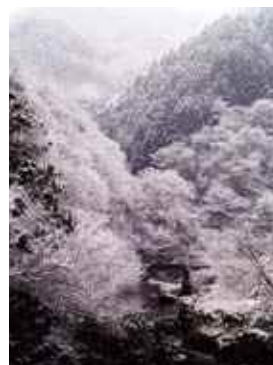
入賞 「川は流れる」 しげまん