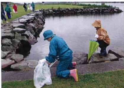
▲川沿いもていねいに

当日はあいにく雨が降りしきる天候の中での清掃活動となりましたが、全体では9団体から約1,300人もの大勢の参加者が清掃に汗を流されました。そこには吸い殻やプラスチックゴミ、ビン、缶、ペットボトルなど様々なゴミがうち捨ててありました。全体では約6トンものゴミが集まりました。