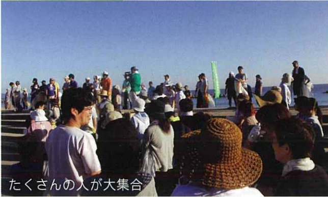
たくさんの方が大集合