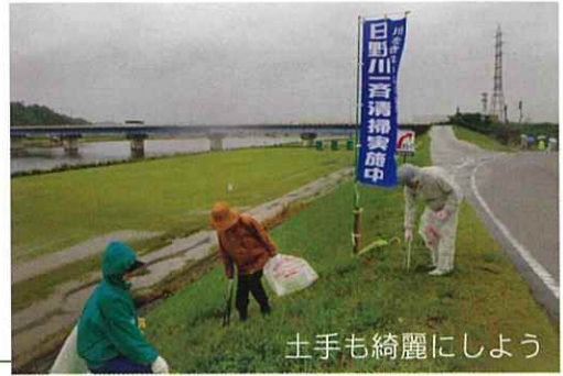
土手も綺麗にしよう