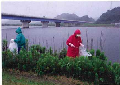
▲草むらも念入りに