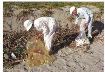
みんなで力をあわせて、清掃しました