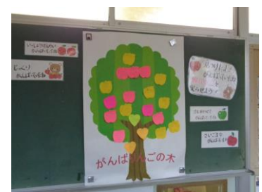
【がんばりんごの取組】