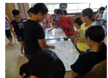
【ホワイトボード・ミーティング®を活用した学期末の話し合い】