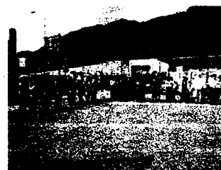
合同街頭広報・智頭