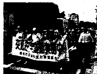
交通安全パレード・倉吉