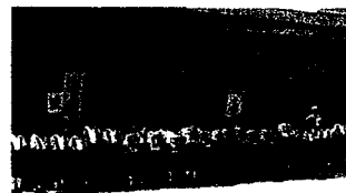
交通安全推進式・米子