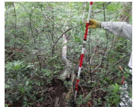
写真二 雪害を受けたコシアブラ