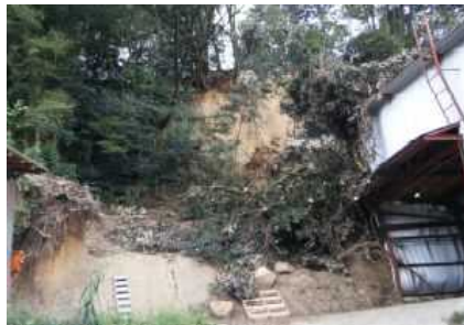
鳥取市青谷町早牛