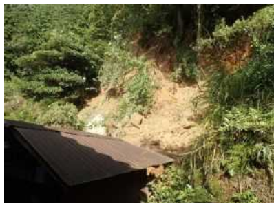
西伯郡南部町鴨部