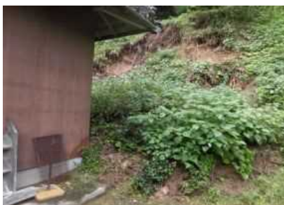
東伯郡琴浦町山田