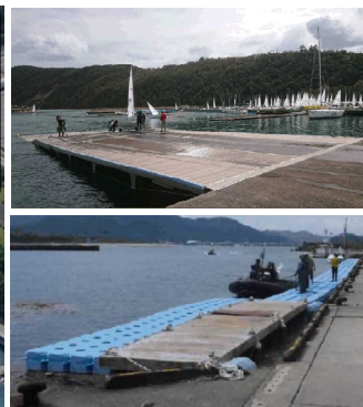
整備例 H30 福井国体 (上:スロープ,下:浮棧橋)