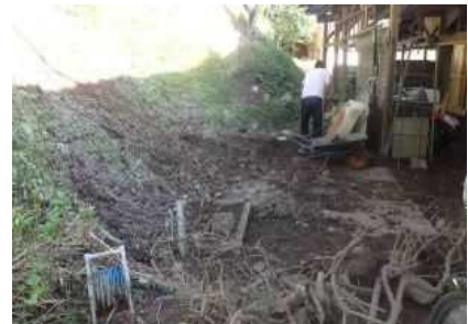
西伯郡南部町馬佐良