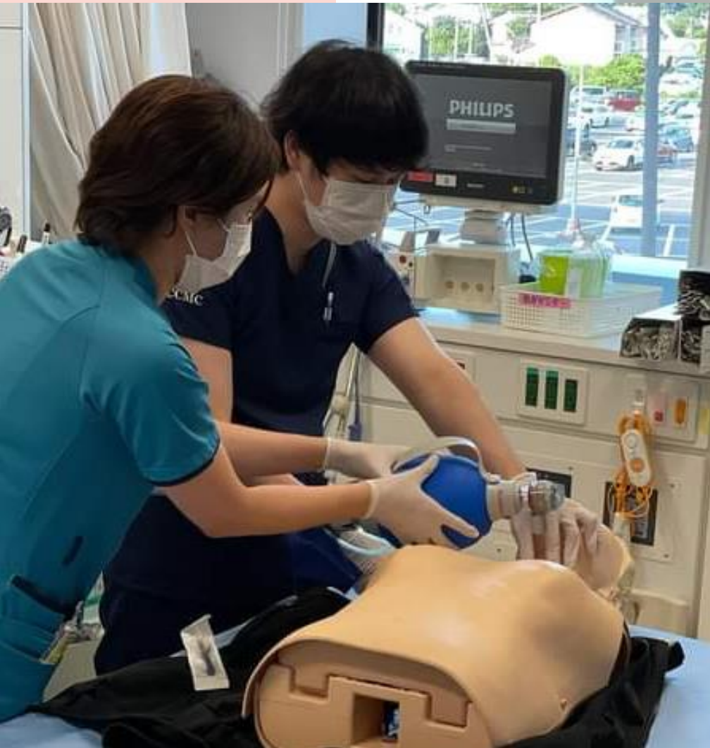
医師による勉強会 & シミュレーション