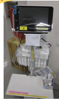
トスカ (呼吸器機能評価)