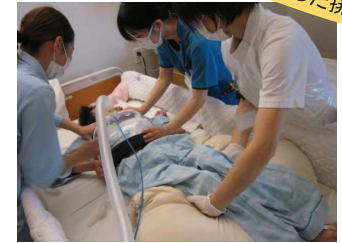
RTX (機械を使った排痰)

排痰しやすいように機械を付けブルブル振動を与えて排痰援助します 心地よくて寝てしまう児もいます