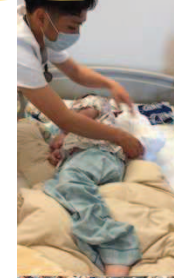
リハビリテーション

他職種と協働し、自分では体を動かすことが困難な児に毎日リハビリテーションを行っています