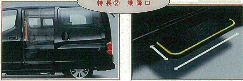
とくちょう じょうこうぐち 特長② 乗降口

あんぜんかくほ にぎ 安全確保のため、握りやす く視認性の高い配色の 乗降用手すりを装備。 スライドドアの開閉に 連動したステップを装備。