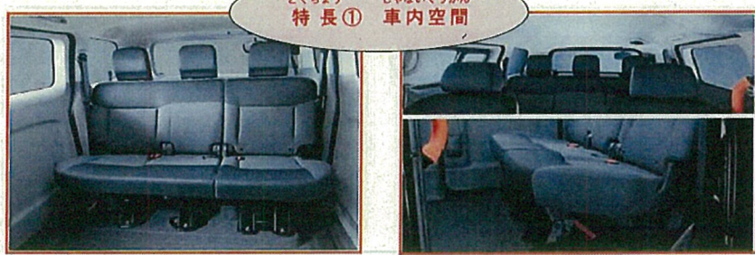
とくちょう しゃないくわん 特長① 車内空間

たて よこ 縦にも横にもゆとりのあ る空間を確保し、ゆったり くつろげる移動空間を 確保。