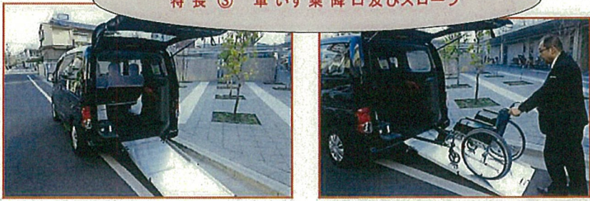
とくちょう くるま じょうこうぐちおよびスロープ 特長③ 車いす乗降口及びスロープ

ゆとりのある高さとはばを 確保することで、安全安心 な乗り降りが可能。 スロープ幅を広く、勾配を 緩やかにすることで、スム ーズな乗り入れが可能。