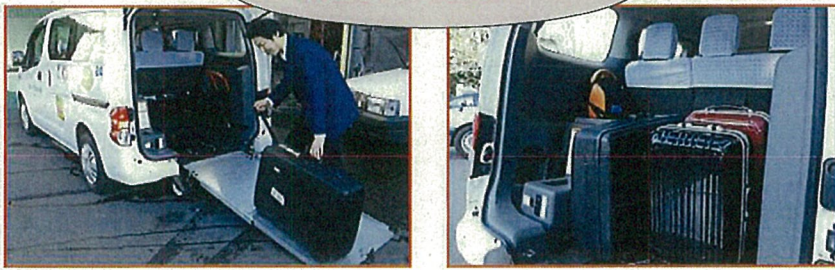
とくちょう 特長⑤ ラゲッジスペース

ひろびろ 広々としたラゲッジスペ ースを確保することで大 きな荷物も余裕で収納で きます。