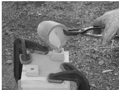
青銅鏡づくり(鑄込みの様子)