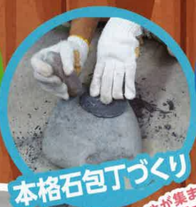
本格石包丁づくり