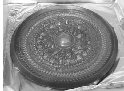
三角縁神獣鏡チョコレートづくりの様子と完成品(福井市立郷土歴史博物館提供) (直径22cmの実物大の青銅鏡をチョコレートでつくります。)