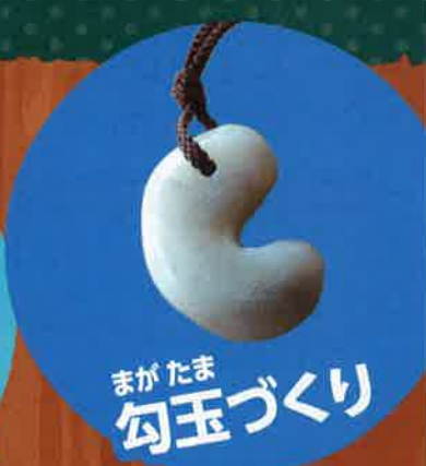
まがたま 勾玉づくり