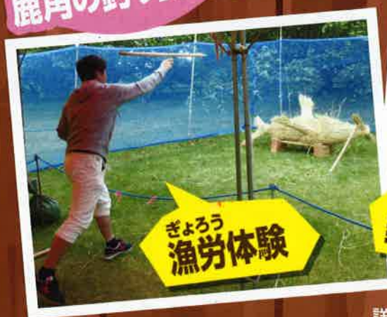
ぎょうろ 漁労体験