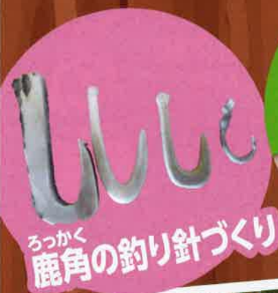
ろっかく 鹿角の釣り針づくり