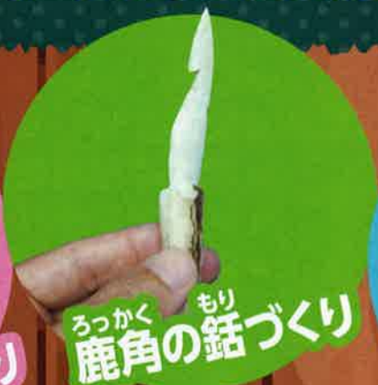
ろっかく もり 鹿角の鉤づくり