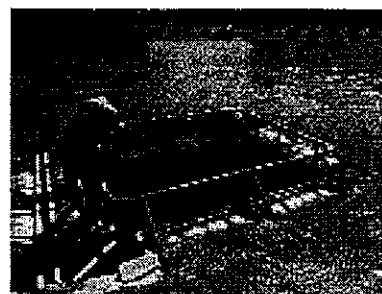
小割生簀 [3m×3m×2m (18t)]