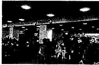
国際線搭乗待合室