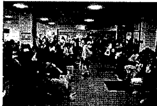
国内線搭乗待合室