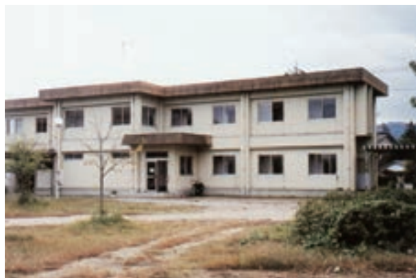
昭和57年2月に建設された男子寮