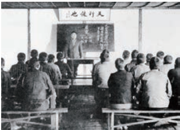
学習風景（修農1期生）