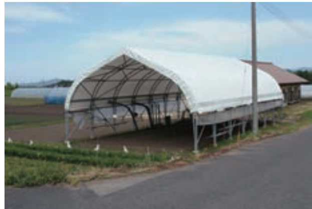
タスコドーム（全天候型実習圃場）