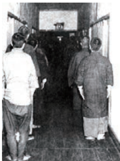
夕べの礼拝風景（修農2期生）