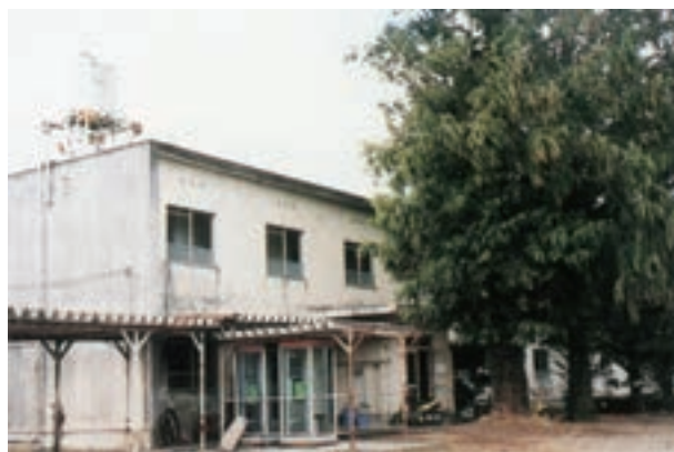
農業経営大学校時代からの男子寮(昭和41年9月建設)