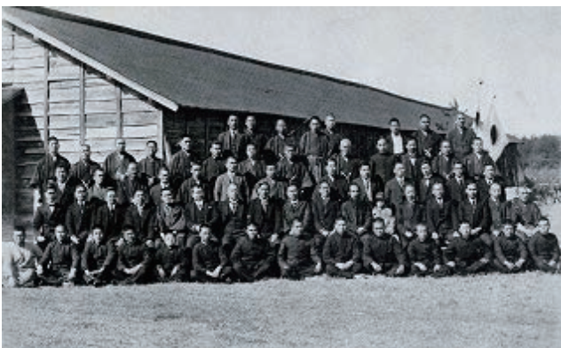
山陰国民高等学校開校式（昭和4年2月22日）