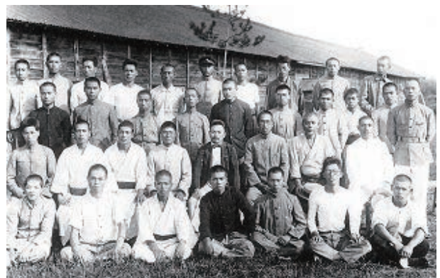
山陰国民高等学校初の修了生（昭和4年8月）