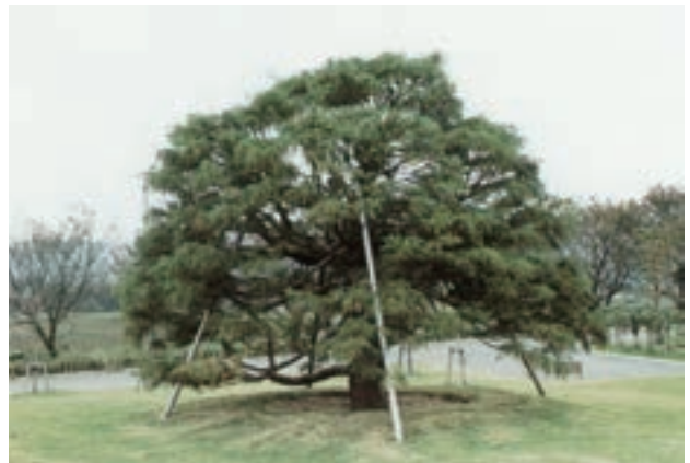
円形広場に移植されたヒヨクヒバ（イトヒバ）