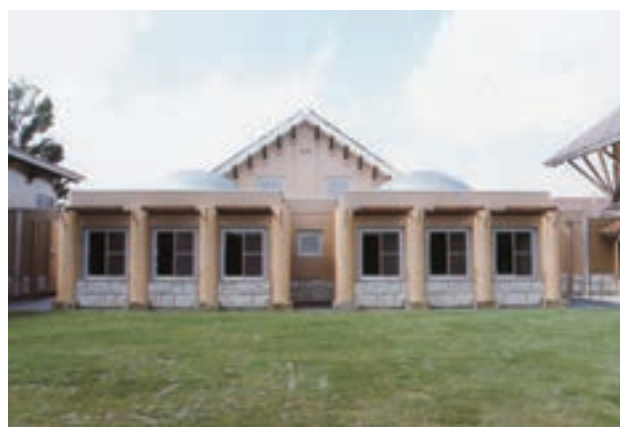
教室棟（大教室と第3・第4教室）