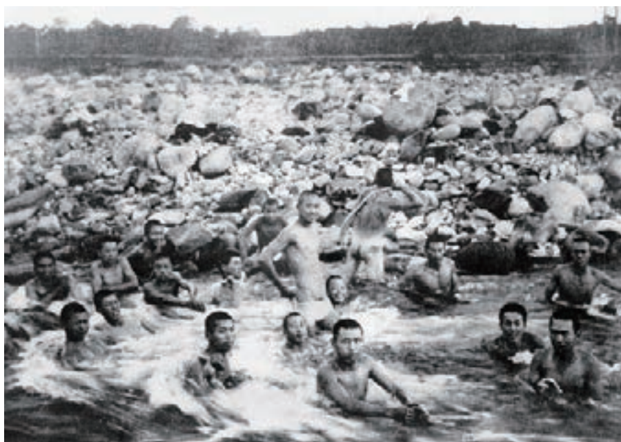
小鴨川での禊ぎ風景（修農2期生）