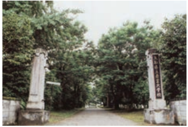
移植前のニセアカシア並木