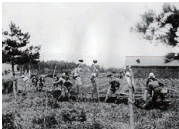
開墾風景（修農1期生）