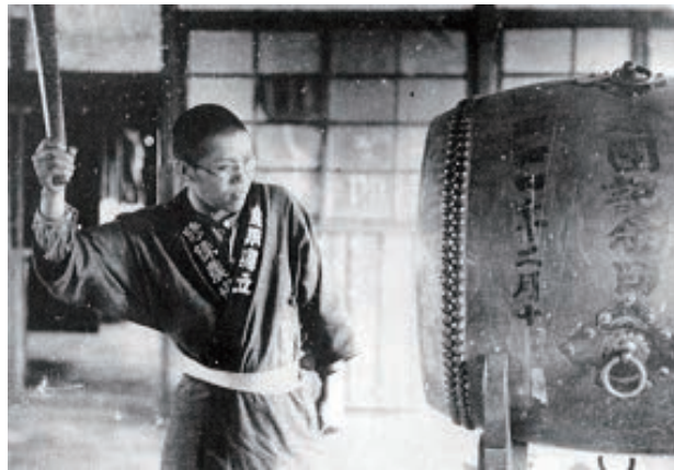
太鼓の合図（修農2期生）