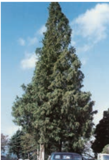
巨木となって駐車場に影をおとすメタセコイア