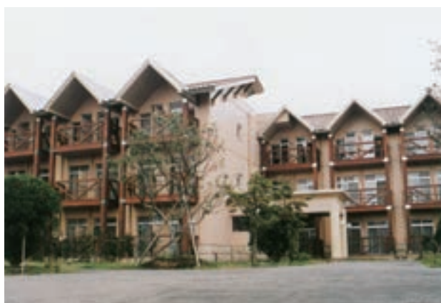
ペンション風の寮