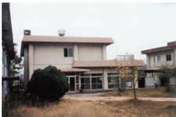
昭和56年3月に建設された女子寮と食堂