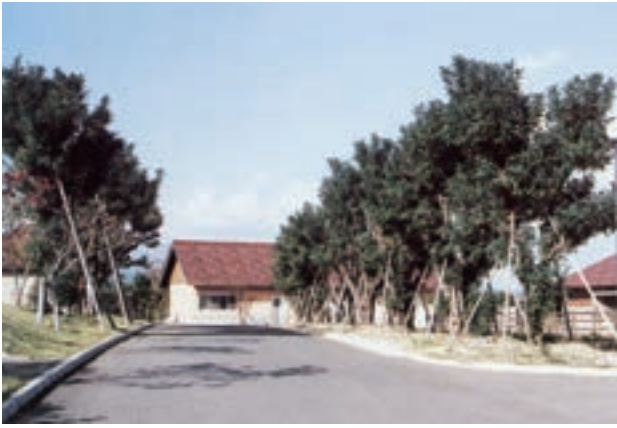
牛舎と円形広場の間に移植されたニセアカシア並木