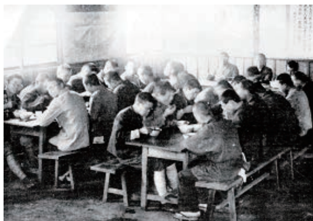
食事風景（修農1期生）