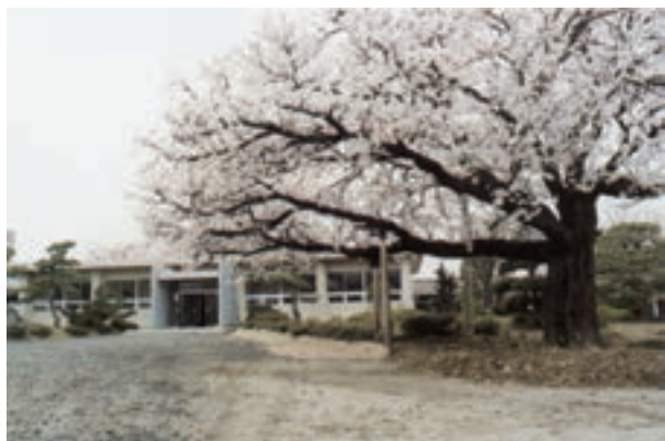
農業大学校時代の本館(61年2月建設)