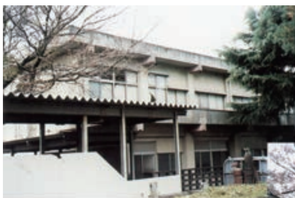
営農研修館 (43年3月建設)