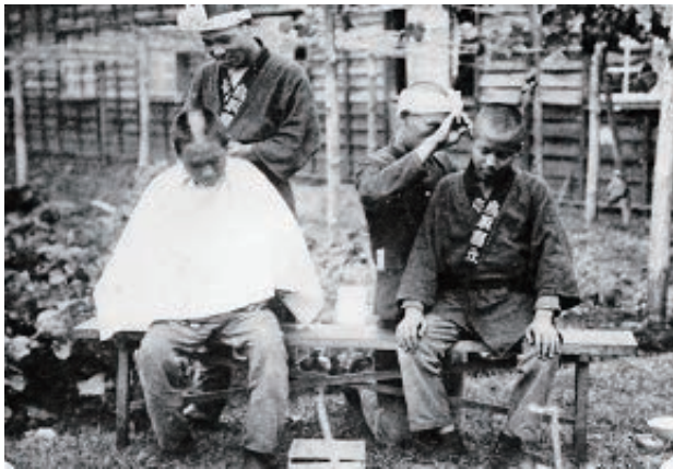
散髪風景（修農2期生）