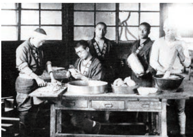
炊事風景（修農1期生）