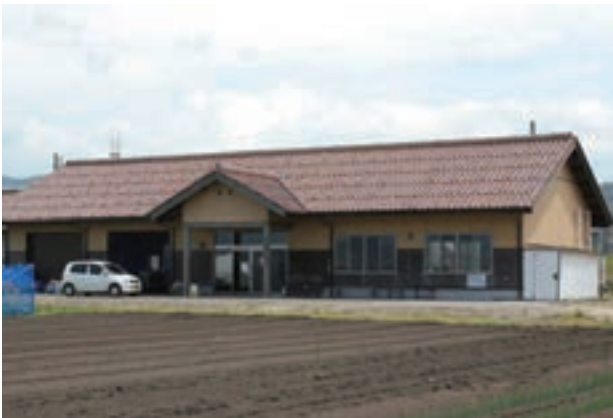
農業学習館（研修科施設）