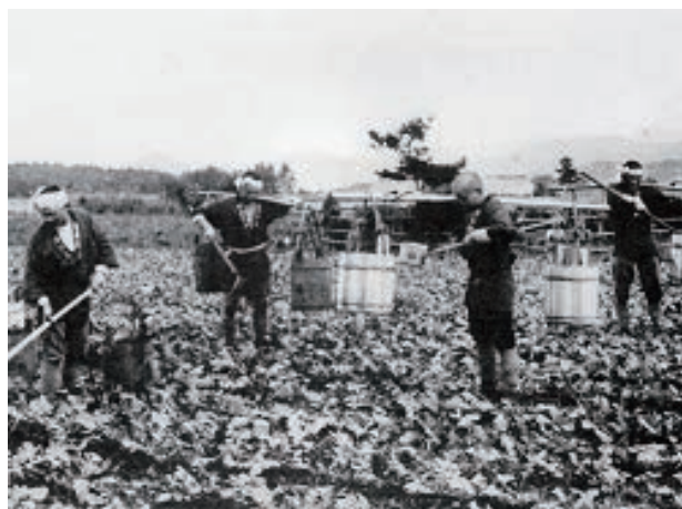
大根施肥風景（修農1期生）