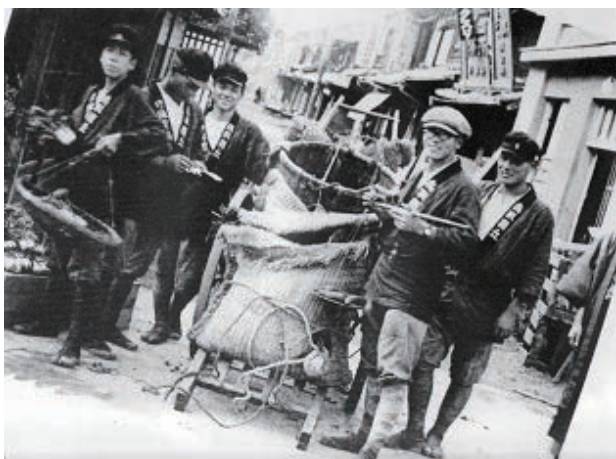
イモ販売風景（修農1期生）