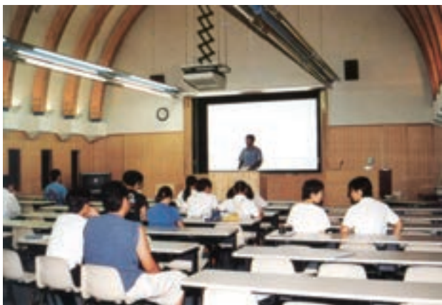
最新の視聴覚器材の整った大教室