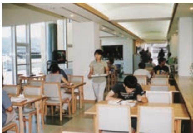
カフェテラス風の明るい食堂