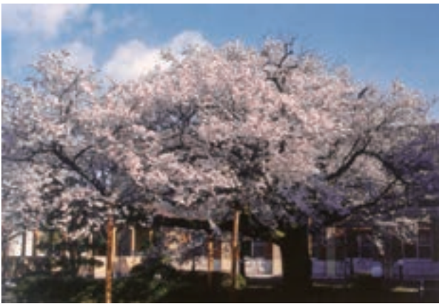
桜の巨木、旧本館前の元の位置 現在は教育棟と寮の中庭