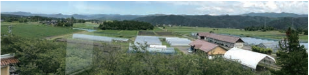
圃場全景（野菜・花き・畜産コースおよび研修科圃場）