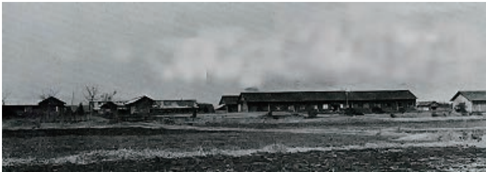
旧陸軍演習地の建物を利用した山陰国民高等学校全景（昭和6年撮影）