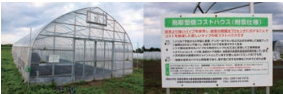
鳥取型低コストハウス（モデルハウス）