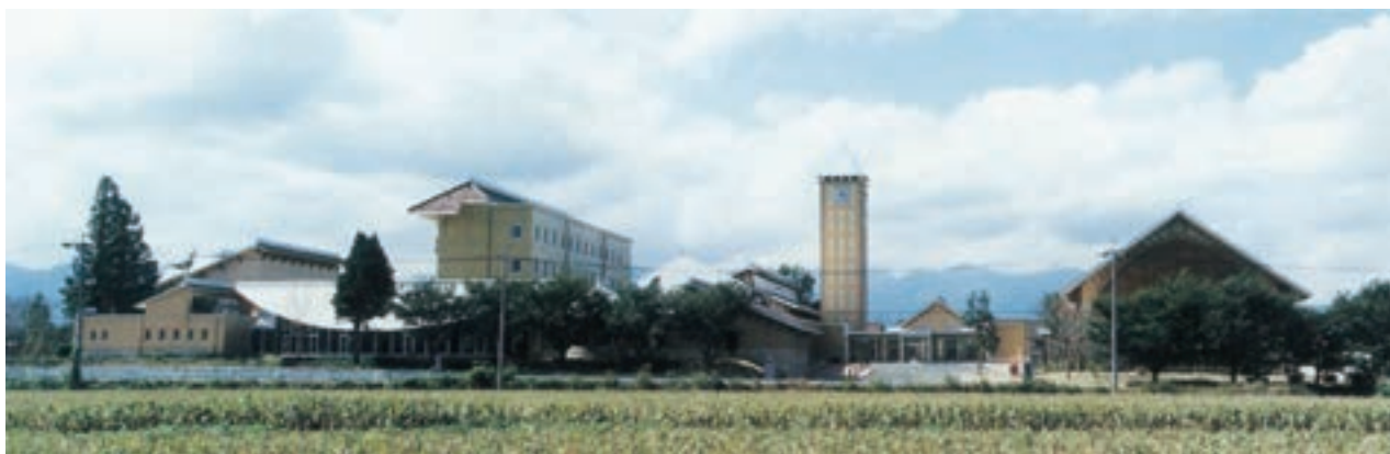
農業大学校東側全景