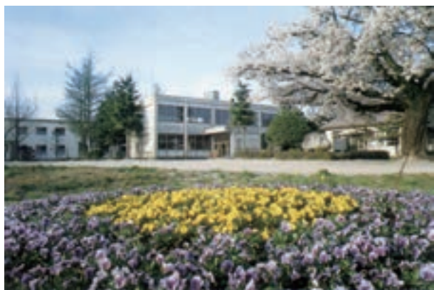
経営伝習農場、農業経営大学校時代の本館(昭和40年3月建設)