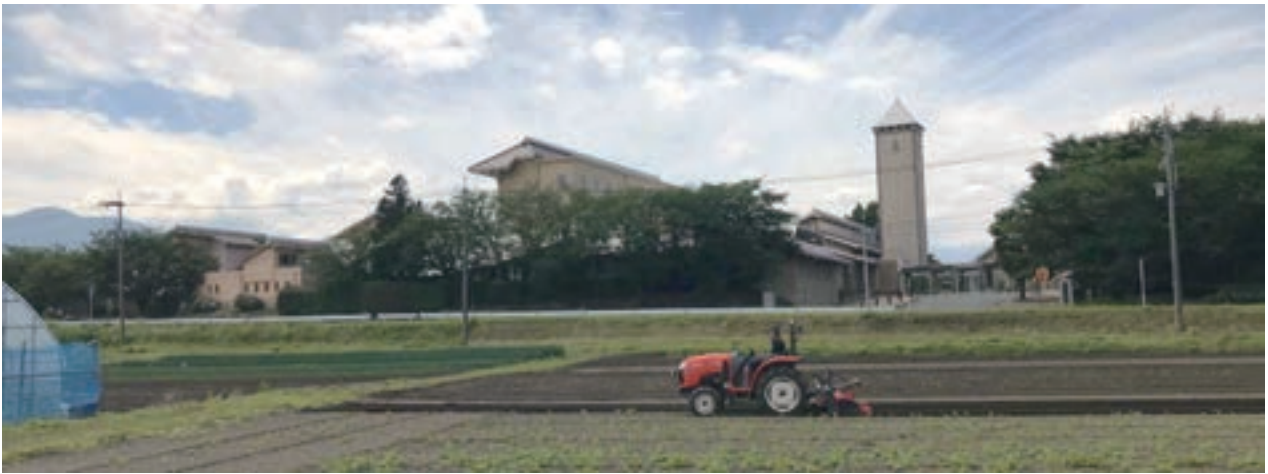
農業大学校東側全景