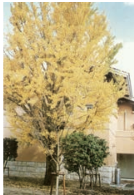
大イチョウ 元の位置 現在は教育棟裏玄関脇