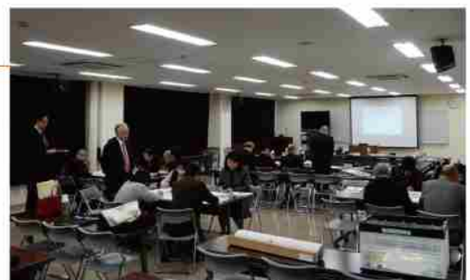
地区公民館の在り方について ワークショップを実施

平成29年度：鳥取市社会教育委員会議答申「地区公民館における社会教育施策について」