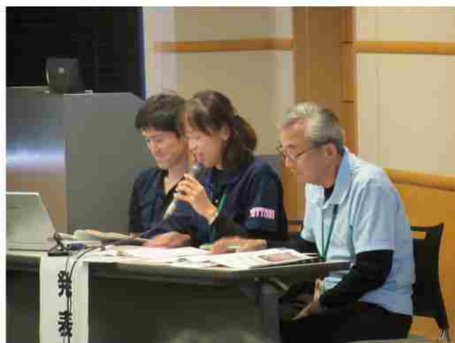
南部町社会教育委員の会