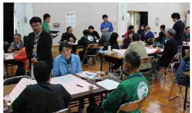
カフェのような雰囲気。社会教育主事たちが 意見を聞き、助言や価値づけをしてくれる。