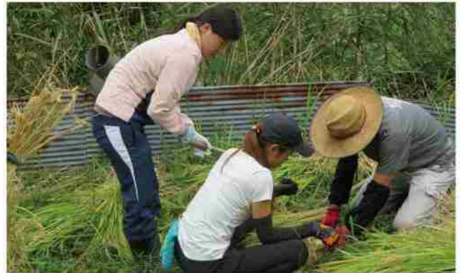
青年団への稲刈り指導