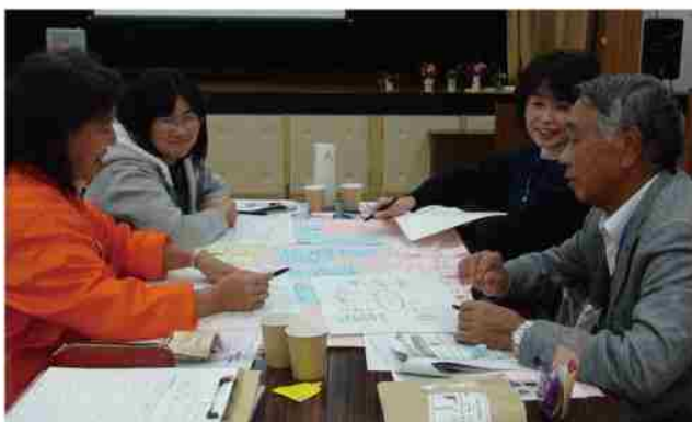
皆が意見を出し合う楽しい研修。 時間がきても話がとまらない。