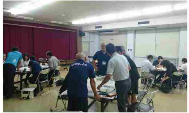
高校生との意見交換