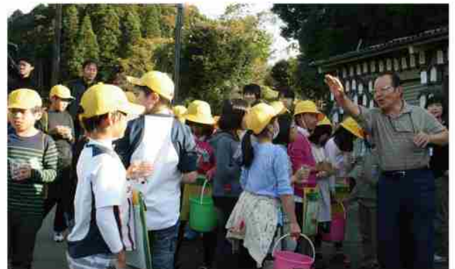
会見小ホタル学習 ゲストティーチャー

今ではシーズン中には1万人ほどの観光客が訪れるようになり、町も駐車場の整備やトイレの設置、警備員の配置等の支援も行うようになりましたが、ほとんどは「ホタル募金」で賄っています。活動を通して、学びを通じた人づくり、つながりづくり、地域づくりが進んでいると実感しています。