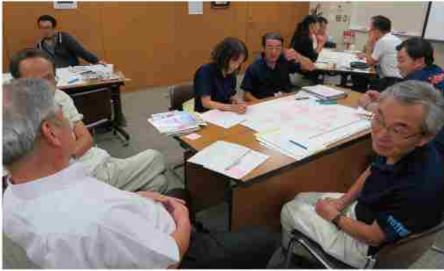
伯耆町との合同研修