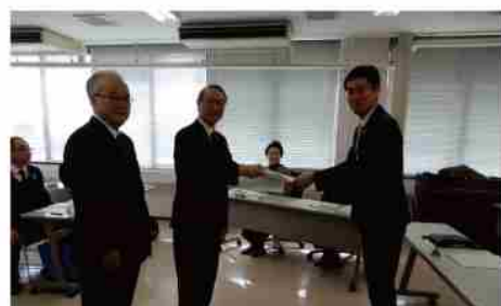
答申を教育長に手交

答申では、昨今の社会情勢やコミュニティ・スクールとの連携、これまで公民館が培ってきた地域における学びやつながりの活用とその充実を図ることを目的として、以下の2点の施策について提言した。