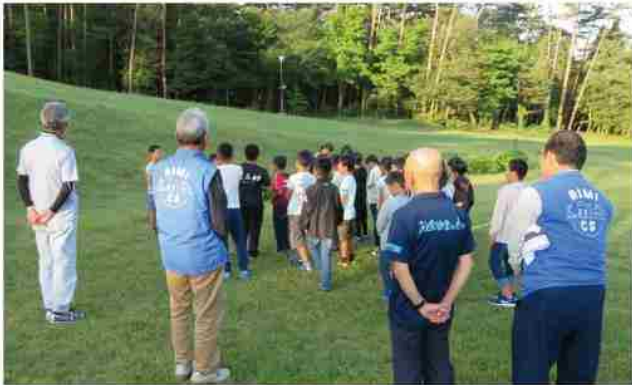
セカンドスクール見守り

芸能大会、小学校セカンドスクール、町民音楽祭、子ども会・高校生サークル・青年団サポート等に積極的に参加し、地域の実態を知るようにしている。