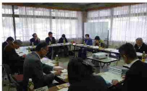
倉吉市社会教育委員協議会