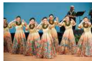
昨年の大会の様子

には、前夜祭(湯梨浜町)や交流フラ(琴浦町・北栄町)、奉納フラ(三朝町)なども開催。詳細はお問い合わせください。