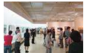
昨年の県展の様子