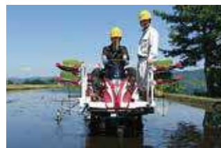
実習風景(作物コース)