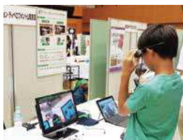
昨年の産業技術フェアの様子(仮想現実(VR)体験ブース)