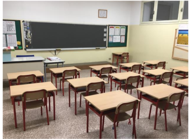
教室です。日本と同じように月～金曜日まで学習します。イタリア語の授業も週に1回あります。