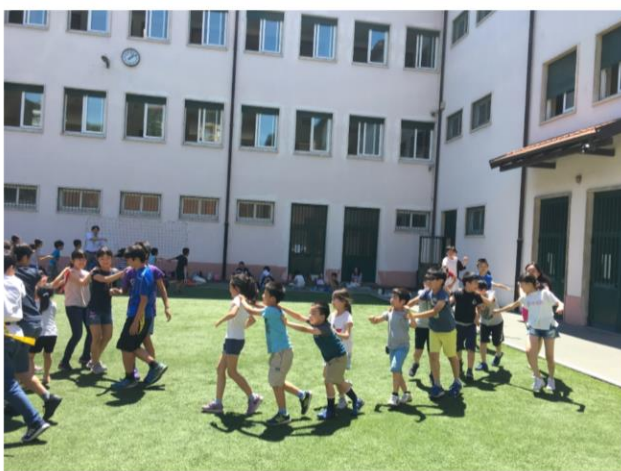
中庭です。日本のような校庭がないので、運動会はミラノの市民体育館を借りて行っています。