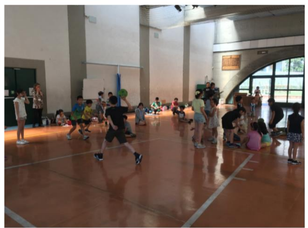
体育館です。限られた範囲でみんなが仲良く遊んでいます。