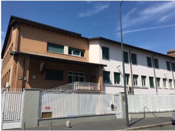
ミラノ日本人学校の校舎です。防犯のため高いフェンスで囲まれています。

ミラノ日本人学校は小学部が62名、中学部21名で1学期をスタートしました。しかし、日本の小学校や中学校と違って、児童生徒の出入りが多い日本人学校ですので、ミラノ日本人学校では1学期の間に7人もの子どもたちが転校していきました。でも夏休みを終えると、今度は新しい友だちがやってきます。このようにミラノ日本人学校では出会いと別れを繰り返しながら一つ一つの出会いと相手を大事にするということを学んでいっています。