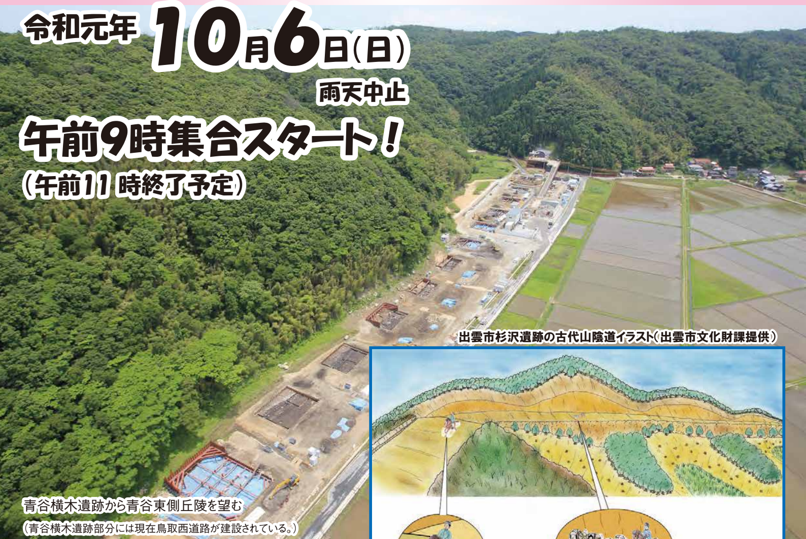
出雲市杉沢遺跡の古代山陰道イラスト