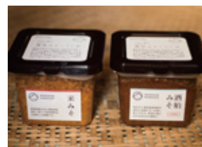
主に都市部に卸し、町内の工房や道の駅でも販売。熟成中、蔵でクラシックを聴かせる