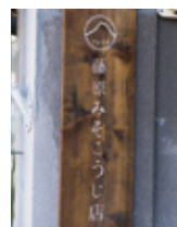
目抜き通り南寄りの町屋に看板を掲げる

若桜町は商工会の補助もあり、開業しやすいまちだと思いますが、これまでの協力隊の状況をみても、任期後に自営業者として町内に定着するには、着任時から卒業を見据えて動くことが重要だと感じます。