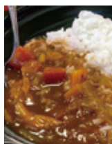
どんどんおいしく成長中のイノシシカレー

併せて取り組んでいるのが、ジビエ料理です。いまはイノシシカレーを開発中。中古車を改造したキッチンカー「とらとら」で、イベントなどに出品しています。今後週に1度、駅前の空き店舗でカレーを提供する予定です。