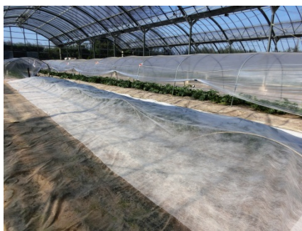
図2 畝中央にポールをアーチ状に設置 (2015)。つる先は左側方向に伸長。