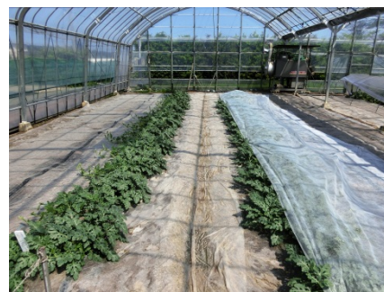
図3 高温対策のため、株元をやや浮かせた状態で不織布べたがけ(2015)。左:無被覆区、右:不織布区