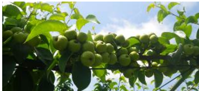
図2 満開60日後の着果状況

x) 同一項目内のアルファベットは多重比較検定(Tukey-Kramer法)により異符号間において5%レベルで有意差があることを示す